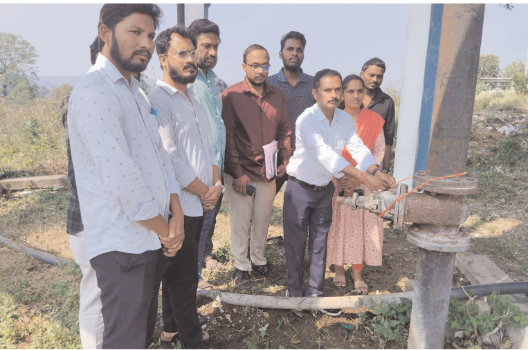
రిపబ్లిక్ హిందుస్థాన్, నార్మూర్ : బుధవారం రోజు నార్మూర్ లో జల్ ఉత్సవాన్ని ఉత్సాహపూర్వకంగా నిర్వహించారు. ఈ కార్యక్రమంలో నీటి ప్రాముఖ్యతపై అవగాహన కల్పించడంతో