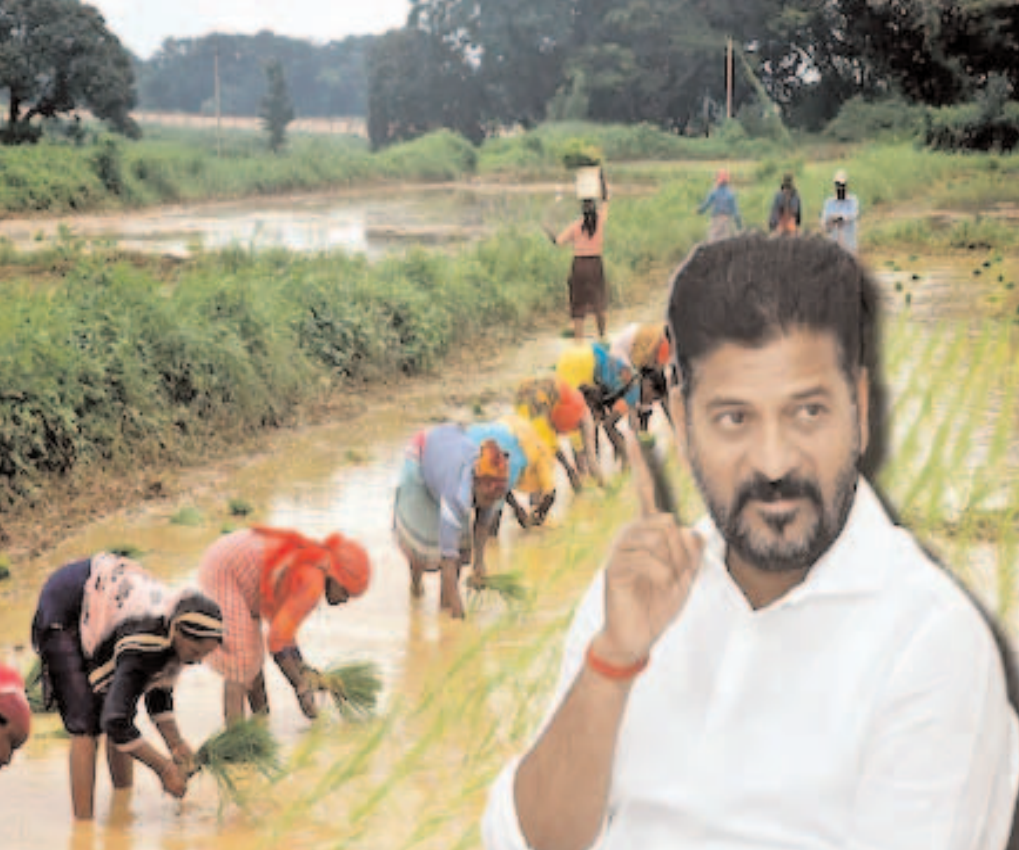
రూ. 2 వేల కోట్ల చొప్పున జమ చేసేలా 45 రోజుల్లో కనీసం రూ. 7 వేల కోట్లు జమ చేసేలా ప్రభుత్వం ప్రణాళికలు సిద్ధం చేస్తుంది. రాష్ట్ర వ్యవసాయ శాఖ సాగు లెక్కల ప్రకారం 1.39 కోట్ల ఎకరాల్లో పంటలు సాగయ్యాయి.

-మొదటిపేజీ తరువాయి చేసేందుకు సర్కారు సిద్ధమవుతున్నదని సీఎం రేవంత్ రెడ్డి చెప్పిన విషయం తెలిసింది. ఈ నేపథ్యంలో ఇప్పుడు గత సర్కార్ హయాంలో రాళ్లు, రబ్బలు భూములు, గుట్టలు, హైవేలు, రోడ్లు, వెంచర్లు, భూసేకరణ కింద పోయిన భూములకు వేల కోట్ల రూపాయలు రైతుభరోసా కింద వధాగా చెల్లించినట్లు తేల్చింది. వానాకాలం నుంచా? యాసంగి నుంచా? రైతులకు వంట పెట్టుబడి సాయం ఈ నెలాఖరు నుంచి పంపిణీ చేయాలని రాష్ట్ర ప్రభుత్వం సూత్రప్రాయంగా నిర్ణయించింది. కానీ దాన్ని వానాకాలం నుంచి లెక్కగట్టి ఇస్తారా? లేక ఈ యాసంగి నుంచి రైతు భరోసా జమ చేస్తారా? అనే విషయంలో స్పష్టత లేదు. అయితే రైతు భరోసాకు నిధులను సర్దుబాటు చేయాలంటూ ఆర్థిక శాఖను సీఎం రేవంత్ రెడ్డి ఇప్పటికే ఆదేశించినట్లు సమాచారం. ఎప్పటి వాదిరిగానే ఒక ఎకరా నుంచి మొదలుపెట్టాలని, డిసెంబర్ నెలాఖరు వరకైనా సరే రైతుల ఖాతాలకు నిధుల జమ ప్రక్రియను పూర్తి చేయాలని భావిస్తున్నట్లు అధికారిక వర్గాలు తెలిపాయి. వాస్తవానికి దసరా తర్వాత నుంచే రైతు భరోసా పంపిణీ చేయాలని తొలుత ప్రభుత్వం భావించింది. కానీ, అప్పటికే రుణమాఫీ కోసం రూ.18 వేల కోట్లు రైతులకు విడుదల చేసింది. దీంతోపాటు మరికొన్ని స్కీములకు నిధులు సర్దుబాటు చేయాల్సి వచ్చిందని ప్రభుత్వ వర్గాలు తెలిపాయి. దీంతో రైతు భరోసా వాయిదా పడుతూ వస్తున్నది. అయితే డిసెంబర్ నెలలో జరగనున్న స్థానిక ఎన్నికల కంటే ముందే రైతుల ఖాతాల్లో పెట్టుబడి సాయం జమ చేయనున్నట్లు సమాచారం. ప్రతి 10 రోజులకు రూ.1,500 కోట్ల నుంచి